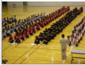
東関東推薦団体発表