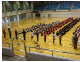
表彰受ける各団体代表