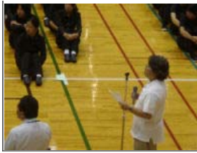
事務局長の成績発表